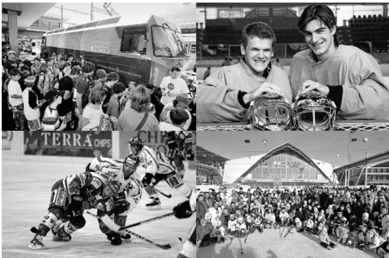
Highlights Saison 2007/08: Starke Partner und Fans, starke Torhüter, mentalstarke Mannschaft in den Playoffs, starkes Team Canada am Spengler Cup