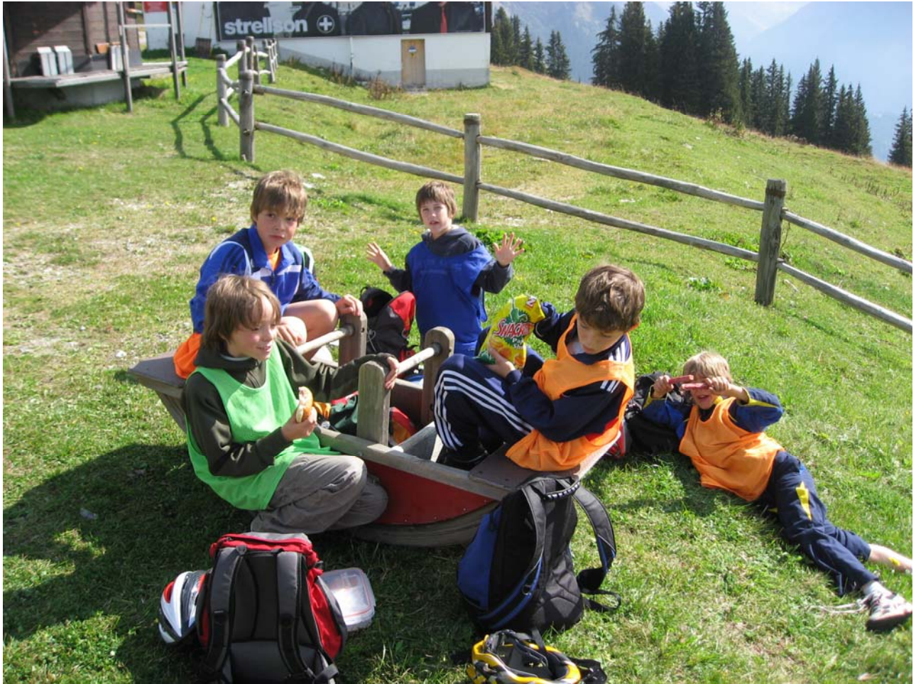
„Beim Essen nicht spielen und nur gesunde Nahrung“, hat doch Mami noch gerufen.....